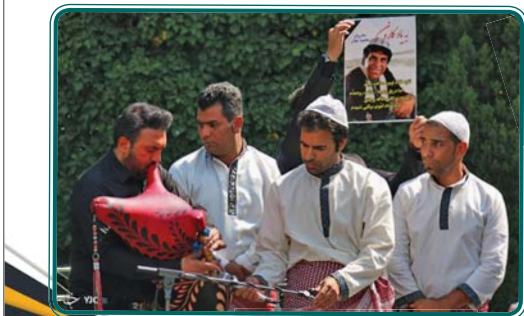
مراسم تشییع پیکر محمود جهان