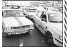
بر خورد با مالکان تاکسی های فرسوده

معاون امور شهرداری های سازمان شهرداری ها و دهیاری های کشور اعلام کرد در اجرائی طرح نوسازی ناوگان تاکسیرانی شهرداری که از بهمن ۹۴ و با حمایت دولت آغاز شده، تاکنون بیش از ۵۵ هزار تاکسی فرسوده از ناوگان تاکسیرانی شهرداری کشور خارج و تاکسی های جدید جایگزین آنها شده است. شهردار مصوم می بیان داشت: در این طرح که تاثیر زیادی در رفاه شهروندان، ارتقای سطح ایمنی خودروها و کاهش آلودگی هوا دارد، تاکنون بیش از ۷۸ هزار تاکسی که بیش از ۱۰ سال گذشته فرسوده و بی ایمنی رسیده، ثبت نام کرده اند. وی ادامه داد: همچنین بیش از ۵۵ هزار تاکسی جدید تحویل متقاضیان