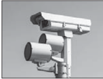
اصلاح سیستم پیش تصویر ی شهرضا

معاون امور شهرداری های سازمان شهرداری ها و دهیاری های کشور اعلام کرد در اجرائی طرح نوسازی ناوگان تاکسیرانی شهرداری که از بهمن ۹۴ و با حمایت دولت آغاز شده، تاکنون بیش از ۵۵ هزار تاکسی فرسوده از ناوگان تاکسیرانی شهرداری کشور خارج و تاکسی های جدید جایگزین آنها شده است. شهردار مصوم می بیان داشت: در این طرح که تاثیر زیادی در رفاه شهروندان، ارتقای سطح ایمنی خودروها و کاهش آلودگی هوا دارد، تاکنون بیش از ۷۸ هزار تاکسی که بیش از ۱۰ سال گذشته فرسوده و بی ایمنی رسیده، ثبت نام کرده اند. وی ادامه داد: همچنین بیش از ۵۵ هزار تاکسی جدید تحویل متقاضیان