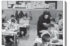
موافقت با استخدام معلمان حقوق‌التدریس

وزیر آموزش و پرورش از تهیه این نامه اجرایی استخدام معلمان حقوق‌التدریس خبر داد. معلمان حقوق‌التدریس خبر داد. معلمان حقوق‌التدریس نوشته امده است: «میروز با گردش کاری که خدمت را به صورت منظم جمهوری داده بود، به منظور تعیین تکلیف معلمان حقوق‌التدریس که مشمول مصوبه شهردار مجلس بودند با تهیه این نامه اجرایی استخدام آنها طبق ضوابط موافقت کردند. نامه شد.»