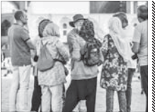
علت افزایش سفر آمریکایی‌ها به ایران

توسط سازمان اداری و استخدامی کشور و براساس نیاز استان‌ها باید یک دوره آموزشی را در دانشگاه فرهنگیان طی کند تا پس از شرکت در آزمون پایان دوره و اخذ نمره قبولی به استخدام درآید. مدیرکل امور اداری و تشکیلات وزارت آموزش و پرورش نیز گفت: فرایند احصای نیاز که شرط اصلی برای تحقق استخدام است در رشته، جنسیت و موقعیت مورد نیاز توسط آموزش و پرورش انجام شده است و به محض اعلام سهمیه توسط سازمان امور اداری و استخدامی و پیش بینی منابع مالی در بودجه سنواتی، آموزش و پرورش آمادگی دارد مطابق این نامه اجرایی فرایند استخدام را شروع کند.