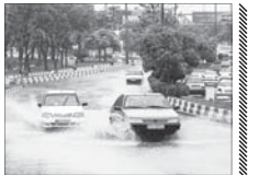
شایعه بارش های بسیار شدید و اقیعیت دارد؟