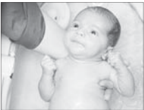
کمترین نرخ باروری در میان کدام گروه است؟

ندارد و شایعه است. مردم نباید به آن توجه کنند و نباید انتظار اتفاقی عجیبی را داشت.