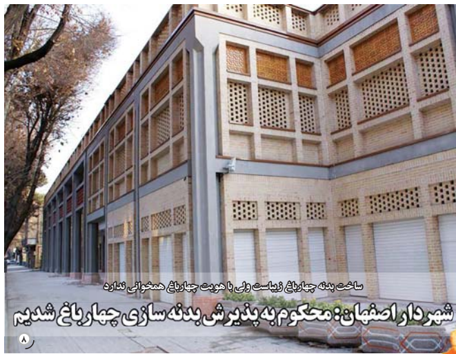
ساخته پدیده چهارباغ ژیباست ولی با هیئت چهارباغ همخوانی ندارد شهردار اصفهان: محکوم به پذیرش پدیده سازی چهارباغ شدید