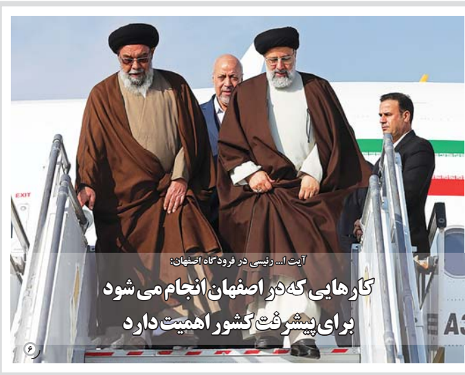
آیت الله رئیسی در فرودگاه اصفهان

تیم فوتبال ذوب آهن اصفهان در هفته سیزدهم رقابت های لیگ برتر میزبان پرسپولیس است. هفته سیزدهم رقابت های لیگ برتر فوتبال، جام خلیج فارس امروز پنجشنبه ۱۴ آذر ماه با برگزاری شش دیدار به پایان می رسد و در یکی از این رقابت ها ذوب آهن اصفهان... در صفحه ۵ بخوانید