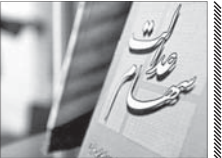
سود سهام عدالت اسمال یکجا پرداخت می‌شود

سود سهام عدالت اسمال به صورت یکجا به حساب همه مشمولان واریز خواهد شد. می‌ان سهام عدالت به صورت مرحله به مرحله از آذر ماه آغاز و معمولاً تا خرداد ماه سال بعد ادامه پیدا می‌کند. اما طبق شنیده‌ها، سود سهام عدالت سال مالی ۹۷ خلاف دو سال قبل، به صورت یکجا واریز خواهد شد. در این راستا، یک مقام مطلع اظهار کرد: در دوره‌های قبلی سود سهام عدالت به صورت گروه‌گروه واریز می‌شد. به این معنا که ابتدا از اقشار ضعیف شروع می‌شد و در ادامه به تدریج برای همه مشمولان واریز می‌شد.