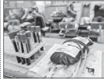
نخیره خونی در اصفهان به ۲/۵ روز رسید