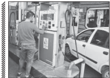
صرفه جویی ۱۹ هزار لیتری بنزین در اصفهان

عملیات شستشوی شبکه فاضلاب شهر ورزنه با واشر جت به صورت منظم، با جدیت و نظارت مسئول فنی و بهره برداری آغاز شده است. در این عملیات حدود ۵۵ کیلومتر شبکه فاضلاب و ۱۸۰۰ متر مینول فاضلاب شستشوده خواهد شد. این اقدام به منظور ارائه خدمات مطلوب و رضایتمندی مشترکان به خصوص در ایام فصل بارندگی که می‌تواند از جمله عوامل فرگشتی شبکه فاضلاب باشد اجرا می‌شود.