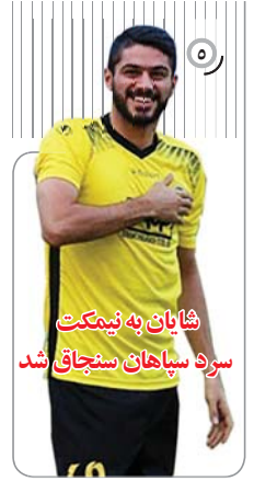
شایان به نیکت سرد سپاهان ستیاقی شد