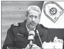
بازداشت ۷ عامل اصلی اغتشاش‌ها در اصفهان

افراد در مخفیگاه‌های خود شناسایی و دستگیر شدند. به گزارش پایگاه خبری پلیس، فرمانده انتظامی استان اصفهان تخریب و آتش زدن تعدادی یگانگ ناوگان حمل و نقل شهری و بمب‌های شوری چراغ‌های راهنمایی و راهنمایی و المان‌های شهری، مسدود کردن تعدادی از خیابان‌ها و بزرگراه‌ها و تخریب مردم به تجمعات غیرقانونی و اقدامات هنجار شکنانه را از جمله اتهامات متهمان دستگیری شده بیان کرد. وی خاطر نشان کرد: متهمان در مواجهه با اسناد و مدارک پلیس به تخریب و آتش زدن اموال و اماکن عمومی و تحریک مردم به منظور اخلاص در نظم عمومی اقرار کردند.