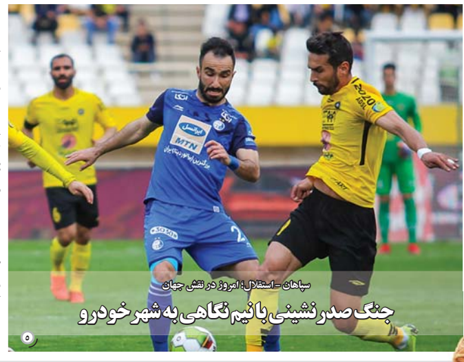
دیدار سپاهان و استقلال در هفته بیست و نهم لیگ برتر در فصل گذشته که در اصفهان به سود استقلال به پایان رسید