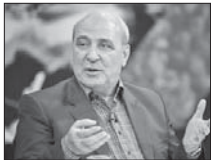
مطالعه احداث خط مترو از زرنیبه تا شاهین شهر