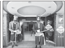
خلأ فعالیت اهالی تئاتر اصفهان رفع شد

وجود دارد این موضوع باعث می شود تمام شهرهای کشور در جمله استان اصفهان در معرض خطر این ویروس باشند. وی افزود: تاکنون بر اساس نمونه هایی که برای تشخیص ویروس کرونا انگلیسی در اصفهان به ارسال شده، هیچ مورد مثبتی شناسایی نشده است. وی در مورد ارسال و ارسال نمونه های مشکوک ابتلا به کرونا انگلیسی، گفت: فقط افرادی که با نمونه های تأیید شده کرونا انگلیسی در ارتباط بوده اند و با سافورت از کشورهای مبدأ کرونا انگلیسی داشته اند شناسایی شده و نمونه آنها به تهران ارسال می شود.