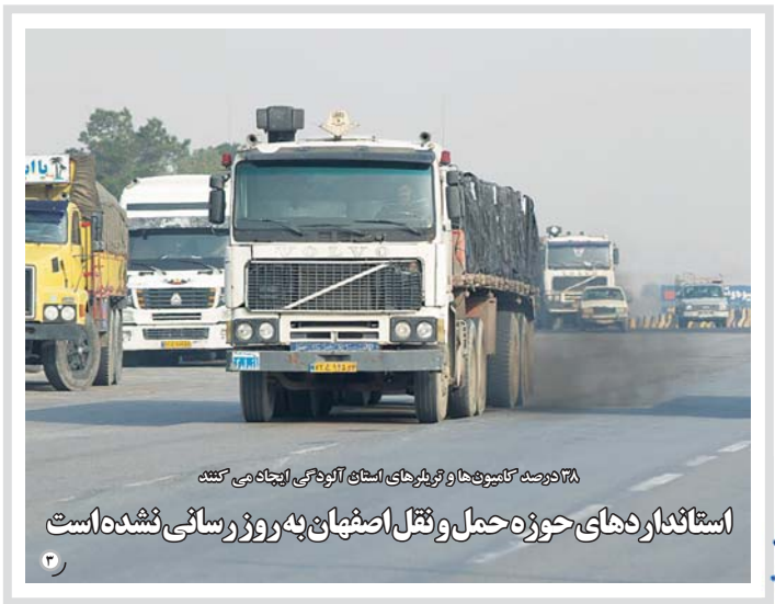
۳۸ تانکر کلمین و چهار تریلرهای اسنک آلودگی ایستگاه می کشند استانداردهای حوزه حمل و نقل اصفهان به روز رسانی نشده است

مجسمه پرویز تناولی به دروازه دولت بازگشت