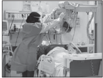
میزان شیوع کرونا در استان ۱۵ درصد است

وی اضافه کرده: به علت رعایت شیوه‌نامه‌های بهداشتی مانند ماسک زدن و شست و شوی مداوم دست‌ها در پاییز با دانشگاه علوم پزشکی اصفهان گفت: در حالی شیوع ویروس کرونا به این میزان رسیده است که بیشترین میزان مبتل شده بر این در استان اصفهان مربوط به شهر تبریز است. حدود ۶۷ درصد از بیماران شیوع ویروس کرونا به سیر کاهش تعداد بیماران سرپایی دارای علائم کرونا در استان اصفهان، افزود: از دی، میزان ویروس کرونا به طور تقریبی ثابت مانده و در میان بیماران سرپایی ویروس سرپایی و بستری بیمارستانی و مراکز بهداشتی ۱۶ ساعت به حدود ۱۵ درصد است.