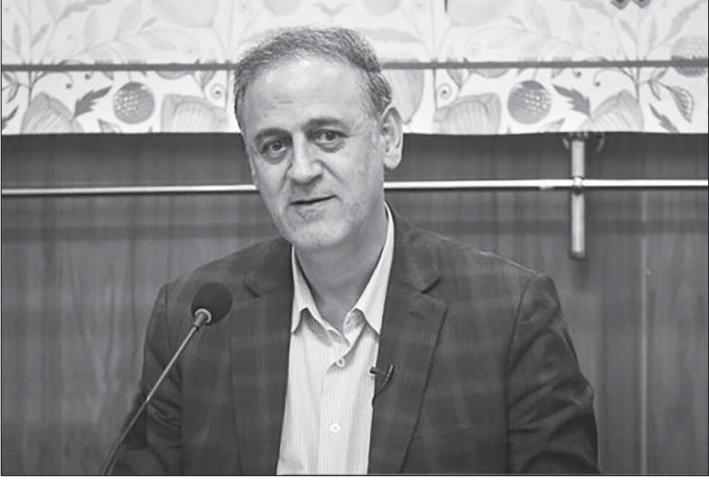
آیا مهلت بخشودگی جرایم مالیاتی تغییر کرده است؟