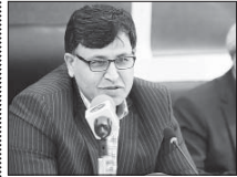
رونمایی از فرهنگنامه بزرگ شهروندی

ما همد، شهروندان و خانواده‌ها باید چگونگی رفتار و ورزشی شهرداری اصفهان به منظور ارتقای دانش شهروندان و تبدیل شدن دانش آنها به رفتار به تهیه فرهنگنامه بزرگ شهروندی و مجموعه کتاب‌هایی تحت عنوان «کتاب‌های نرفای» اقدام کرده که حاوی توصیه‌ها و آگاهی‌هایی در زمینه‌های گوناگون برای شهروندان است. سابقه «شهر من اصفهان» بر این اساس هر ماه با یک موضوع از این کتاب‌ها برگزار شود و در نخستین مسابقه مسووع از شهرداری اصفهان، موضوع چگونگی رفتار صحیح با افراد دارای معلولیت در جامعه انتخاب شده به این دلیل که افراد دارای معلولیت بخشی از جامعه ما را تشکیل