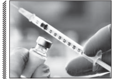
توزیع ۹۷ هزار دوز واکسن آنفلوآنزا بین گروه های هدف

ما همد، شهروندان و خانواده‌ها باید چگونگی رفتار و ورزشی شهرداری اصفهان به منظور ارتقای دانش شهروندان و تبدیل شدن دانش آنها به رفتار به تهیه فرهنگنامه بزرگ شهروندی و مجموعه کتاب‌هایی تحت عنوان «کتاب‌های نرفای» اقدام کرده که حاوی توصیه‌ها و آگاهی‌هایی در زمینه‌های گوناگون برای شهروندان است. سابقه «شهر من اصفهان» بر این اساس هر ماه با یک موضوع از این کتاب‌ها برگزار شود و در نخستین مسابقه مسووع از شهرداری اصفهان، موضوع چگونگی رفتار صحیح با افراد دارای معلولیت در جامعه انتخاب شده به این دلیل که افراد دارای معلولیت بخشی از جامعه ما را تشکیل