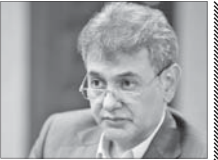
حذف کامل دفترچه بیمه تا ۶ ماه آینده

مقابل درمان برخوردار است این ویروس فعلاً در مقابل واکنش‌ها مقاومت بیشتری برخوردار است، ولی آنچه از مردم درخواست می‌شود فقط و فقط رعایت پروتکل‌ها و دستورالعمل‌های بهداشتی است. وی از مشاهده علامت ویروس هندی در هندی‌هایی که به کشورمان وارد شده اند خبر داد و افزود: این ویروس به مردم این افراد ۲۲ فرد در ۲۲ فروردین و دوم اردیبهشت بوده احتمال زیادی وجود دارد که ویروس هندی جدید به کشور وارد شده باشد، ولی خوشبختانه هیچکدام از افراد دارای بیماری شدید نیستند. البته نگرانی‌های ما پاره‌جاست؛ زیرا برخی از استان‌های جنوبی ممکن است دچار مشکلاتی باشند.