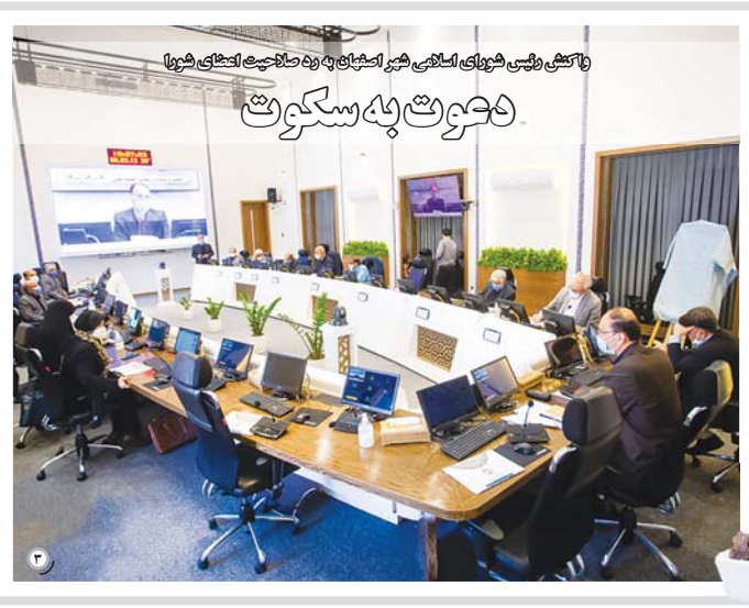
واکنش رئیس شورای اسلامی شهر اصفهان به رد صلاحیت اعضای شهر

جلسه ۲ ساعته اصلاح طلبان با استاندار درباره رد صلاحیت ها