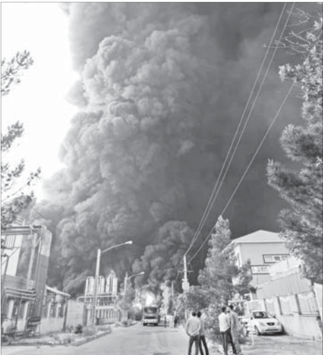
خطر بزرگی که از سر شهرک صنعتی قم گذشت

گسترش حریق به مخازن الکل بودند، در اثر انفجار و پاشیده شدن مواد شعله‌ور بر روی یک خودروی آتش نشانی و جاری شدن حریق در کوچه‌های مجاور از طریق جوی آب، تعداد خودروی عملیاتی آتش نشانی را کم و شهرک صنعتی شکوهیه به طور کامل سوختند و تعدادی از خودروهای شخصی نیز که در کنار خیابان پارک شده بودند و امکان فرار برای آنها به دلیل حریق انجام شده در انتهای یکی از کوچه‌های محل حادثه و مسدود شدن مسیر ورود و خروج نبود در این حادثه از بین رفتند.