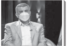
نگرانی شدید وزارت بهداشت از ویروس آفریقایی

معاون کل وزارت بهداشت، با اشاره به مشاهده موردی از ویروس هندی در کشور، گفت: نگرانی اصلی ما ویروس آفریقایی است. این خبر چیزی است که تا قوت انواع ویروس‌های کرونا گفت و افزود: مردم باید یک اصل را رعایت کنند و آن اصل رعایت فاصله گذاری و دستورالعمل‌های بهداشتی است. مردم خودشان را درگیر و اسیر نمانند اما نگرانی اصلی ما از ویروس کرونا، افریقایی‌سازیش است. وی باقی انواع ویروس و کروناست زیرا تجربیاتی که در عرصه بین المللی مشاهده می‌شود ویروس آفریقایی حتی از ویروس هندی و برزیلی از جهش‌های پیچیده‌تر و مقاومت بیشتر از