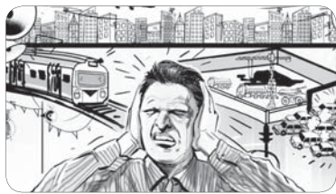
مطالعات جدید محققان مرکز پزشکی در لس آنجلس نشان می دهد آلودگی صوتی در ابتدای افراد به فشار خون بالا تاثیر گذار است.

همچنین مطالعات این محققان نشان می دهد نرخ افزایش فشار خون در زنان سریعتر است و از سنین پایین‌تری آغاز می شود. همین امر باعث می شود زنان بیشتر از مردان مستعد بیماری‌های قلبی عروقی باشند. مردان در سن ۲۰ سالگی در مقایسه با زنان فشار خون بالاتری دارند ولی در دهه ۴۰ زندگی زنان در این زمینه از مردان سبقت می گیرند، به طوری که فشار خون زنان در دهه چهارم فشار خون مردان در دهه ۶۰ زندگی قابل قیاس است. محققان هورمون‌ها را در این امر مدخل می دانند. مطالعات محققان نشان می دهد بهترین زمان اندازه‌گیری فشار خون در افرادی که فشار خون بالا دارند، صبح است؛ چرا که فشار خون بالا در صبح، با افزایش احتمال سکنه مغزی مرتبط است. بر اساس این مطالعه احتمال سکنه مغزی در افرادی که فشار خون صبح در آنان بیش از ۱۵۵ میلی متر جیوه است، نسبت به افرادی که فشار خون صبح کمتر از ۱۳۵ میلی متر جیوه دارند، هفت برابر بیشتر است؛ البته این موضوع در فشار خون عصر صادق نیست زیرا فشار خون عصر می‌تواند تحت تاثیر عواملی همچون دوش آب گرم یا غذای مصرف شده باشد.