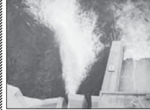
زمان دقیق بازگشایی زاینده رود

انجام می‌گرفت. دبیر اجرائی نظامى صفى کشاورزى استان اصفهان یادآور شدند: البته آبی هم که قرار است برای رفع تکلیف در راستای کنت کشاورزان شرق و غرب رهاسازی شود به هیچ وجه کف کنت‌ها را نمی‌دهد. شاید برای آبیاری درختان، کنت‌های اصفهان و مصرف کشاورزان که دارای سخر و یا چاه هستند تا حدودی فایده‌بخش باشد. وی در رابطه با میزان روزه‌های جارى بودن زاینده رود خاطر نشان کرد: برای پاسخ به این سؤال لازم است آب به مدت یک هفته تا ۱۰ روز رها باشد تا رفتار طبیعى رودخانه مشاهده شود و سپس می‌توان رایج به این موضوع تصمیم‌گیری نمود.