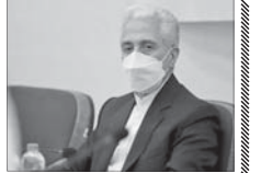
جزئیات واکسیناسیون مرحله ای دانشجویان

وزیر علوم، تحقیقات و فناوری جزئیات واکسیناسیون دانشجویان را تشریح کرد و گفت: واکسیناسیون به صورت مرحله ای از مردادماه در واکسیناسیون دانشجویان تحصیلات تکمیلی آغاز می شود. متصور غلامی گفت: مسئولان مربوطه تعهد داده اند که اگر واکسن مورد نیاز تأمین شود از مردادماه نیز برنامه شروع خواهد شد. او افزود: واکسیناسیون دانشجویان تحصیلات تکمیلی به دلیل کمبود واکسن و کمبود واکسن های ایرانی خواهد بود یا خبر افزود: هنوز مشخص نیست چرا که تشخیص این مورد بر عهده وزارت بهداشت و درمان و آموزش پزشکی بوده و ما متخصص این وزارتخانه