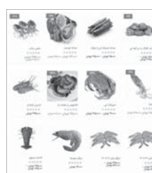
مجموعه عکس های مربوط به انواع حشرات و جانوران

این روزها ایرانیان مانند هشت پا ماهی هر کلامی از هر جنس که از یک طرف، حرام گوشت هستند و از طرف دیگر جز گوشت های در خطر انقراض، به دست سودجویان از خلیج فارس سید شده و به عنوان گوشت لاچگری یا قیمت های گزاف با به صورت آنلاین به فروش می رسد و با در فروشگاهها و رستوران ها عرضه می شود. مشتری برای این از برای حرام گوشت و در خطر انقراض و ترویج مصرف رانشان بر عهده شبکه های اجتماعی است و کلیه های که بینه در به چنین طعم این موجودات ترغیب می کنند.