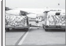
محموله جدید واکنس هنوز به اصفهان نرسیده است

محموله جدید به دانشگاه علوم پزشکی سرعت خواهد گرفت. وی ادامه داد: تست‌های مثبت در استان اصفهان حدود ۲۵ تا ۲۰ درصد و ثابت مانده است، تعداد بستری‌های روزانه نیز حدود ۸۰۰ بیمار در روز است که این آمار نیز ثابت مانده و روند کاهش آمار را شاهد هستیم. سختگوی دانشگاه علوم پزشکی اصفهان در خصوص شروع موج پنج در استان اصفهان، خاطر نشان کرد: هشدار در خصوص موج پنجم به این دلیل است که آمار بیماران کرونا و پروس ثابت شده و تغییرى در این دهنه نمی‌شود و این موضوع نگران کننده است.