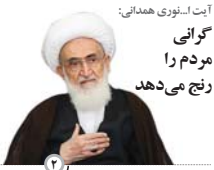
آیت‌الله‌نوری همدانی: گرانی مردم را رنج می‌دهد