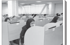
کنکور ۱۴۰۳ بدون کاغذ برگزار می شود