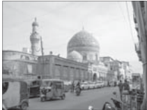
چرا سفر عراق از کیش و استانبول گران تر است؟