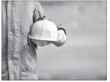
حق بیمه اسمال کارگران چقدر شد؟

براساس اطلاعیه سازمان تأمین اجتماعی، حداقل دستمزد روزانه منتهی وصول قیومه بیمهشدگان مشمول قوانین کار و تأمین اجتماعی مبلغ ۱۲۶ هزار تومان اعلام شد.