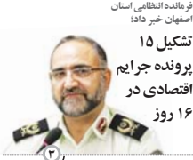
فرمانده انتظامی استان اصفهان خبر داد: تشکیل ۱۵ پرونده جرایم اقتصادی در روز ۱۶