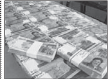
در آمد اصفهان بیشتر از پیش‌بینی‌ها بود