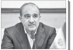
سندسازی در ترکیه وزیر را به مجلس کشاند