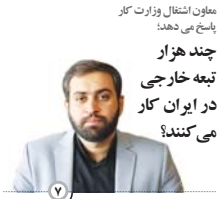
معاون اشتغال وزارت کار پاسخ می‌دهد: چند هزار تبعه خارجی در ایران کار می‌کنند؟