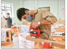
ثبت «سابقه کار» برای سربازانی که مهارت می آموزند