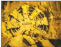
آغاز عملیات حفاری ۳ ایستگاه خط ۲ مترووی اصفهان

وی گفت: سفک‌کاری ایستگاه‌های زینبیه، شهید خرازی و علمان سامانی با عبور تی‌بی‌ام‌رو به پایان است و به‌زودی مراحل نازک‌کاری آن آغاز می‌شود.