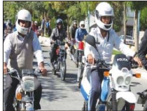
موتور سواران قانونمند اصفهانی مانور برگزار می‌کنند

میدان نقش جهان برگزار می‌شود. سرهنگ محمدرضا محمدی گفت: در حال حاضر پارکینگ‌های سطح شهر اصفهان از موتورسیکلت‌های متخلف اشباع شده است و به نظر می‌آید رفع معضل موتورسواران متخلف به فرهنگ‌سازی و همکاری نهادهای فرهنگی و خانواده‌ها نیاز دارد. او با اشاره به اجرای طرح موتوربا توسط پلیس راهور استان اصفهان افزود: این طرح موتورسواران متخلف را متوقف کرده و از آنان