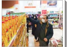
روغن در بازار کشور بازم ارزان می شود