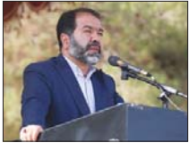
واگذاری زمین در سمیرم با اهلیتسنجی

استاندار اصفهان با اشاره به ضرورت جذب سرمایه‌گذار در شهرستان سمیرم اهلیتسنجی متقاضیان سرمایه‌گذار را در این شهرستان تأیید کرد.