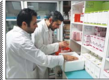
آنتی بیوتیک‌های اطفال به زودی در دسترس خواهند بود

محمول نهایی (آنتی بیوتیک‌ها) این مشکل را حل کرده که تا یک هفته آینده در دسترس شرکت‌ها و عموم قرار خواهد گرفت.