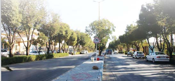
خیابان های جدید در شاپورآباد

شهردار مبارکه با اشاره به آغاز کارهای عمرانی در حوزه های مختلف مدیریت شهری در حوزه های خدمت رسانان از جمله فضای سبز، خدمات شهری، عمران، شهرداری و اتوبوسرانی رقم خورد.