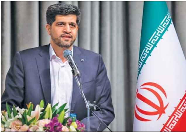
شهریار زرین شهر در جریان افتتاح نگارخانه زرین شهر

وی اظهار داشت: طی مدت گذشته پیگیری های متعددی برای اخذ تأیید ناظر اداره برق شهرستان لنجان و جهت نصب ترانسفورماتورهای برقی خریداری شده و در نهایت اتصال شبکه برق فشار ضعیف شهرک مشاغل کارگاهی زرین شهر به شبکه فشار متوسط انجام شده است که متأسفانه این مهم محقق نشد.