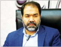
اختصاص نیم درصد از درآمد شهرداری ها به کتابخانه ها

نخستین توجیه و معارفه مدیر مالی شهرداری فولادشهر با حضور شهردار، رئیس و اعضای شورای شهر و مدیران شهرداری برگزار شد.