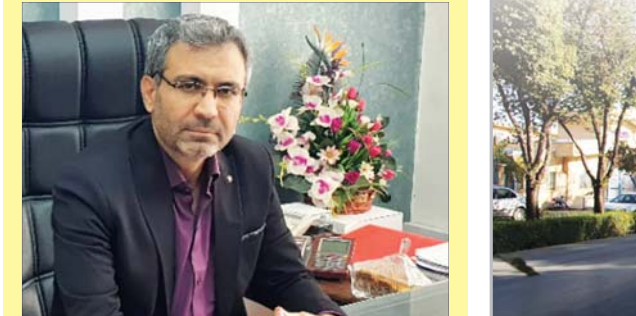
شهردار آران و بیدگل

صافی افزود: اسفالت پروژه های متعدد فرهنگی در شهر آران و بیدگل برگزار کردیم و همایش ویژه حول محور پارک جنگلی کویری پروفیسور کردوانی به عنوان اولین پارک جنگلی کویری کشور و برگزاری جشنواره نمک از جمله این برنامه های فرهنگی بود.