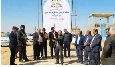
شهردار مبارکه میارکه مطرح کرد:

همزمان با دهه فجر کلنگ احداث منطقه کارگاهی مشاغل مزاحم و پمپ بنزین در شهر شاپورآباد با اعتباری بالغ بر ۲۰۰ میلیارد تومان زده شد.