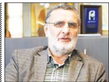
فرایند انتخابات به خوبی در حال انجام است