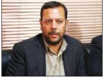
جانمایی ۱۵۰ مکان برای تبلیغات نامزدهای انتخاباتی