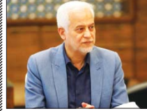
افزایش ۵۰ درصدی بودجه سال آینده شهرداری