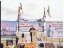
تامین منابع آب، مطالبه جدی اصناف از وزارت نیروست