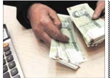
جلسه بعدی تعیین دستمزد