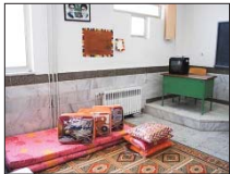
۶۰۰ مدرسه در اصفهان آماده اسکان مسافران نوروزی است