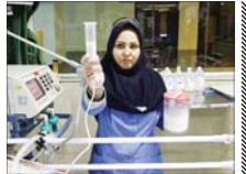
وضعیت مهاجرت پرستاران بحرانی است

عضو شورای عالی نظام پرستاری گفت: مهاجرت پرستاران به مرز بحران رسیده است... وضعیت مهاجرت پرستاران بحرانی است