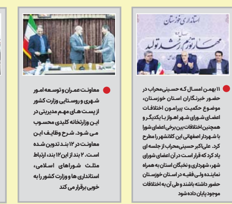
۱۱ بهمن امسال که در حضور خبرنگاران استان خوزستان، موضوع حکمت پیرامون اختلافات اعضای شورای شهر اهواز با یکدیگر و همچنین اختلافات بین برخی اعضای شورا با شهردار اهواز این کلاسشهر را مطرح کرد...

باز هم پای یک اصفهانی در میان است! مهدی اصفهانی در بیان تجربه ترین و سرشناس ترین مدیران اصفهانی در سطوح مدیریتی ملی محسوب می شود. او در دولت های مختلف در استان اصفهان کار کرده و در پست های مختلف نقش های حساس ایفا کرده است.