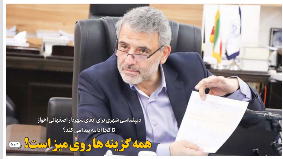
دیپلماسی شهری برای اقای شهردار اصفهانی اهواز تا کجا ادامه پیدا می کند؟ همه گزینه ها روی میز است!

فروش فوق العاده املاک و مستغلات (مزایده شماره ۳۵) (استان اصفهان)