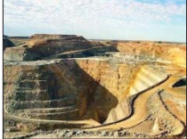
۱۱ معدن غیرفعال در اصفهان احیا شد

کمبلی افزود: مزایای زیادی دیگری برای احیای واحدهای معدنی را که در دستور کار است که در آینده امری خواهد شد. وی بیان کرد: اصفهان انواع گوناگون مواد معدنی دارد و خود جای داده است که از نظر ظرفیت معدنی به عنوان یکی از استان‌های مطرح کشور محسوب می‌شود. وی با بیان اینکه انواع مواد معدنی از جمله طلا، سرب، روی، آهن، مس، باریت و تنونیت در استان اصفهان وجود دارد، خاطر نشان کرد: بیش از ۴۰۰ معدن در استان اصفهان در زمینه سنگ‌های تزئینی و مصالح ساختمانی قابلیت می‌کند که شامل انواع سنگ‌های ساختمانی، مرمریت، مرمر، گرانیت و تالونیت است.