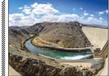
طرح جامع آب حوضه زاینده‌رود در دست اقدام است

طی دو جلسه متوالی با حضور رئیس مجلس علی‌رضا امینودی، معاون تلیق و امور نظیمری شرکت مدیریت منابع آب ایران و مدیر حوضه آبریز رودخانه زاینده‌رود و حوضه‌های جنوب‌غربی قلات در اصفهان، مطالعات طرح جامع آب حوضه زاینده‌رود تشریح و توجیه و تأمین منابع آب استان بررسی شد. سامانی با اشاره به اینکه تأمین منابع آب حوضه زاینده‌رود در دستور کار جدی روستا هسته آبریز زاینده‌رود و مسئولان امر در استانداری اصفهان است، افزود: برای مرتفع شدن مشکلات این حوضه طرح جامع آب در حوضه زاینده‌رود در دست اقدام است و پس از تکمیل و تأیید وزارت نیرو تازیر اجرایی خواهد شد.