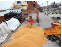
دلیل اعتراض نانوایان به قیمت نان چیست؟