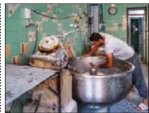
احتمال تعطیلی نانواهای دولتی