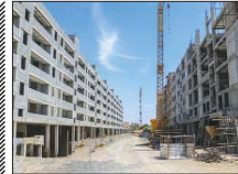
صدور پروانه برای ۲۰ هزار واحد نهضت ملی مسکن

متنی منتشر شد با بیان اینکه کالانشهر اصفهان ۲۲ چندقلو بیشترین چندقلو را دارد، افزود این کالانشهر ۳۶۰ دوقلو و ۲۲ سهقلو دارد همچنین شهرستان های آران و بیدگل، اردستان، شاهین شهر و میمه، ناین و ورزنده، هر کدام با یک سهقلو کمترین آمار سهقلو را به خود اختصاص دادند.