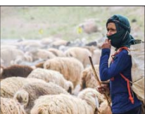
عشایر تقویم کوچ بهار را رعایت کنند