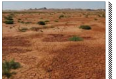
تعداد استان های بیابانی به ۲۰ استان رسید