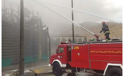
آتش سوزی های چند سال اخیر استان

همه چیز درباره اطفای یکی از سنگین ترین آتش سوزی های چند سال اخیر استان