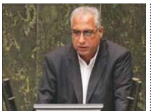
پشت بام خوابی، شایسته مردم کشورمان نیست

عضو کمیسیون عمران مجلس گفت: اخیراً در رسانه خواندم مردم به دلیل ناآشنایی در پرداخت کاره خانه به سمت خانه‌های اشتراکی رفته و چند خانواده در کنار هم زندگی کرده و اجاره و پرداخت می‌کنند، این‌ها را خوشحالی پشت بام خوابی منتشر شده که به هیچ عنوان شایسته و زیسته مردم کشورمان نیست.