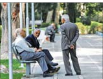
نخوه محاسبه مستمری بالای ۳۵ سال خدمت

وی گفت: در سال‌های اخیر به دلیل عدم تعادل در عرضه و تقاضای املاک شاهد تغییراتی در بازار مسکن بودیم که به تبع آن نرخ اجاره‌ها نیز رشد قابل توجهی داشته و مردم به ویژه اقشار کم درآمد جامعه را با مشکلات زیادی روبرو کرده است.