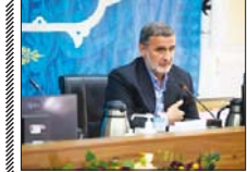
آغاز فرایند برگزاری انتخابات مجلس در اصفهان

معاون سیاسی، امنیتی و اجتماعی استانداری اصفهان در خصوص برگزاری انتخابات الکترونیک در استان اصفهان گفت: هنوز در این زمینه ابلاغیه‌ای نداشتیم و تا زمان اعلام وزارت کشور روند برگزاری انتخابات الکترونیکی مشخص نیست.