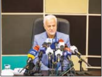
ضرب‌الاجل به متخلفان ساخت و ساز در اصفهان

اجرای بند «ت» تبصره ۴ وارد شوند، اطلاعات خود را به کارگزاران و کد رهگیری دریافت کنند تا در صورت امکان پایان ساخت برای آنها صادر شود. شهردار اصفهان با بیان اینکه شهروندان تا بیست‌ونهم تیرماه اسامی می‌توانند از این فرصت استفاده کنند، گفت: طبق قانون زمان این فرصت قبلاً تکرار است، لذا برای یک بار به کسانی که در ساخت‌وساز تخلف کردند این فرصت داده می‌شود تا از این بند است خارج شوند. وی افزود: ساختمان‌های ۴۰ تا ۳۰ واحدگه احداث شده است که مالکان نمی‌توانند آن را خرید و فروش کنند، لذا می‌توانیم با استفاده از این فرصت این مشکل را رفع کنند.