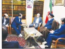
آب مشکل اول و آخر اصفهان است

و جاری شدن زاینده رود به عنوان یک دغدغه اصلی است که اگر کاری از سوی دولت و دولتمردان در این زمینه انجام شده باشد اطلاع‌رسانی شود. امام جمعه اصفهان تصریح کرد: ما اعتقاد نداریم که آب را نباید به دیگران داد، بلکه متقدم، این امر حیاتی می‌برد، عدالت توزیع خشود و به نحوی حوضه‌های آبریز را مدیریت کرد که چالشی بین استان‌ها ایجاد نشود. آیت‌ا.س. سید یوسف طباطبائی نژاد با اشاره به طرح اجباری دریاچه ارومیه گفت: باید دولت فکر عاجلی برای بحث زاینده رود اصفهان بکند.