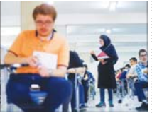
ادعای فروش سنوالات آزمون سراسری تکذیب شد

کرمان، گیلان، مازندران، گلستان، سمنان، تهران، قزوین، البرز، آذربایجان شرقی و آذربایجان غربی بارش‌ها را جز حد نرمال بوده است. وظیفه درباره بارش اینکه کدام استان رکورد کم بارشی است؟ عنوان کرد: خراسان رضوی رکورد کم بارشی است. این استان به طور متوسط باید تاکنون ۲۵ میلیمتر بارش دریافت می‌کرد اما فقط ۱۶ میلیمتر بارش دریافت کرده است. وی اشاره به اینکه استان‌های ساحلی شمال کشور نیز شرایط نگران‌کننده‌ای دارند، افزود: میزان بارش‌ها در گلستان متفی ۳۱ درصد و در گیلان و مازندران نیز حدود متفی ۲۵ درصد زیر نرم است.