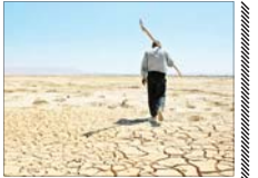
استان رکورددار کاهش بارش در کشور

رئیس مرکز ملی خشکسالی و مدیریت بحران سازمان هواشناسی عنوان کرد: میزان بارش‌ها تاکنون ۲۵ میلیمتر کمتر از نرمال بوده است و به عبارت دیگر حدود ۲۰ درصد کمتر از شرایط نرمال بارش داشته‌ام. احد وظیفه توضیح داد: همه استان‌های کشور شرایط یکسانی ندارند و برخی استان‌ها مانند کنگاپلوه و نوردر احمد، کردستان، ایلام، خوزستان و بوشهر شرایط خوب است و برخی از این مناطق حتی مقداری بیش از شرایط نرمال بارش دریافت کرده‌اند. وی گفت: در مناطق شرقی کشور مانند سیستان و بیلوچستان، خراسان جنوبی، خراسان رضوی، خراسان شمالی، میمنه جنوبی استان فارس، هرمزگان،