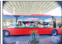
اتوبوس گردشگری روز عید غدیر رایگان است