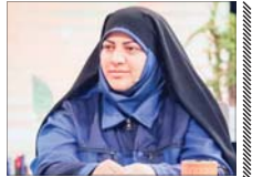
رشد مشاغل رسمی زنان و مشاغل غیررسمی مردان