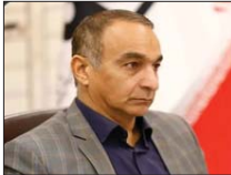
پایش بهداشت آب ۱۲۰ حلقه چاه در شرق اصفهان