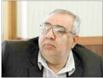
نشانی از تصادفات از شهدای دوران دفاع مقدس فراتر است

رئیس هیئت مدیره کانون عالی انجمن‌های صنفی کارگران با اشاره به افزایش مشاغل رسمی زنان همزمان با افزایش مشاغل غیررسمی مردان گفت: از آنجایی که حداقل دستمزد بسیار کم و جابجایی هزینه‌های خانوار نیست، جمعیت زنانی که جایگزین مردان در کارخانه‌های شده اند افزایش یافته است و این به معنی این است که زنان کمک هزینه مردان در هزینه‌های زندگی هستند. سیمیه گلپور ادامه داد: هر چند عدم انطباق حداقل دستمزد در سالهای اخیر یعنی پدیده سرکوب مزدی، کارگران مرد را برای تأمین حداقل‌های معاش متناسب با افزایش تورم کنترل شده