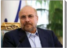
امنیت لبنان مهرون مقاومت حزب... است

رئیس مجلس شورای اسلامی از مقاومت مردم غزه و لبنان تقدیر کرد و گفت: امروز شاهد ثبات، امنیت و امید بودیم. به تومسه در لبنان هستیم که این دستاوردها مروهون مقاومت و پایداری حزب... مردم ایران کشور است. حمدانقر فاللیف و وزیر گذشته پس از ورود به بیروت با اشاره به شکست طرخی رژیم صهیونیستی، گفت: نخست‌وزیر رژیم صهیونیستی پیش از رزجانی کرده بود که به جنوب لبنان حمله خواهد کرد؛ لبنان را نابود خواهد ساخت و حماس را از بین خواهد برد؛ اما امروز خوشحالم که در شرایطی وارد بیروت شده‌ام که مردم غزه و لبنان با مقاومت خود، دشمن را به عقب‌نشینی