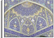
کاشی هفت رنگ اصفهان به ثبت جهانی رسید