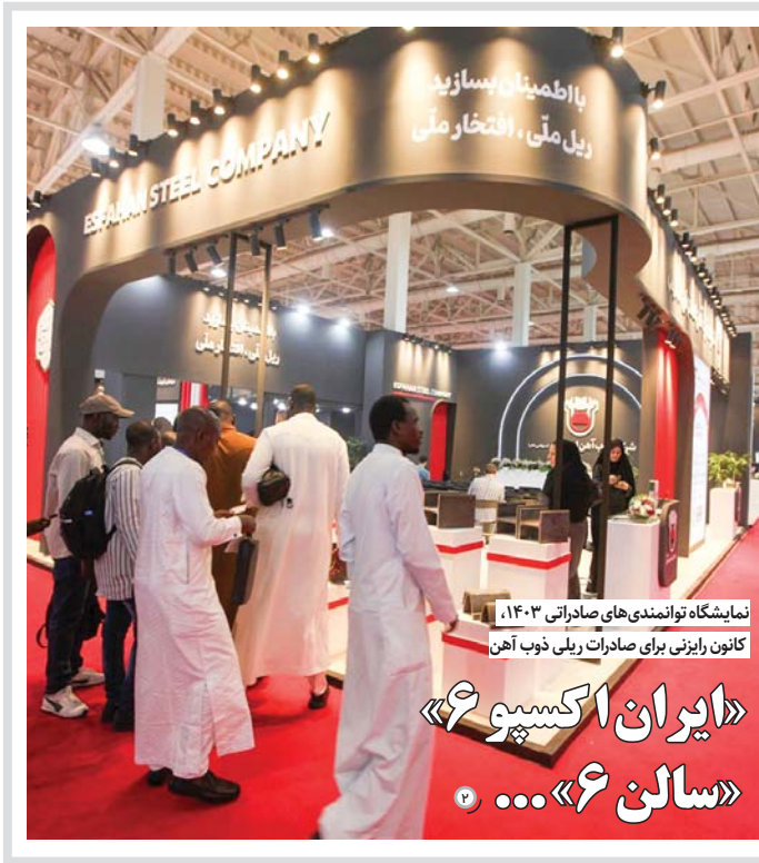
نمایشگاه توانمندی های صادراتی ۱۴۰۳، کانون رایزنی برای صادرات ریلی ذوب آهن