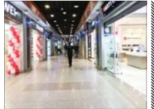
بازار موبایل در رکود مطلق است

رئیس کمیسیون تخصصی موبایل و لوازم جانبی اتاق اصناف ایران از رکود در بازار موبایل ایران به دلیل پایین بودن توان خرید مردم خبر داد.