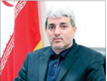
پیشنهاد ۵ ساله شدن سقف قراردادهای موقت

رئیس کمیسیون تخصصی موبایل و لوازم جانبی اتاق اصناف ایران از رکود در بازار موبایل ایران به دلیل پایین بودن توان خرید مردم خبر داد.