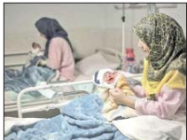
یارانه ۶۰۰ هزار تومانی برای مادران فرزندان کمتر از ۲ سال