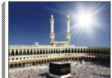
اعزام زائران اصفهانی حج تمتع از سوم خرداد

مدیر حج و زیارت استان اصفهان گفت: استقبال مردم شهید پرو و رولای محمدان استان اصفهان برای زیارت بیت. الحرام می سابقه است. ججتا-اسلام حسین از زردی اظهار داشت: بعد از گذشت ۹ سال وقفه اعزام زائرین بیت.الحرام بود. مراسم افزایش قیمت اعزام کاروان های زیارتی با استقبال عظیم مردم مواجه شده است. استان اصفهان از اولین استان هایی است که ظرفیت کاروان های حج به سرعت تکمیل شده است، تا جایکه بسیاری از مشتاقان زیارت، دلیل کمبود کاروان و مکان، در لیست انتظار برای زیارت بیت.الحرام ماندند. وی افزود: شهرستان اصفهان با ۷ هزار و ۲۴۰ زائر زجر حج