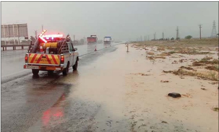
گزارش شد: اکثر نقاط شهرستان با توجه به شدت بارش هایی که بود باعث جاری شدن روان آب و سیلاب شد. طبعیتا شدت بارش ها باعث تخریب برخی جاده های استان اصفهان و روستاها و راهداری شده است.