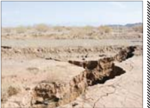
۴۹ درصد جمعیت کشور، تحت تاثیر فرونشست