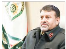
مشارکات پلیس مبارزه با مواد مخدر به حجاج

رئیس پلیس مبارزه با مواد مخدر فرابجا با هشدار به زائران حج گفت: پلیس برابر قانون از ادامه سفر زائران حج که حتی به مقادیر بسیار اندک مواد مخدر، روانگردان، دارو و قرص‌های غیر مجاز و ممنوعه حمل می‌کنند، ممانعت بعمل آورده و برابر قانون با تشکیل پرونده قضایی، مجرم‌ان را به دستگاه قضایی معرفی می‌کند. سردار ایرج کاکاوند بر وجود قوانین سختگیرانه توسط کشور عربستان نسبت به حمل کنندگان مواد مخدر سنتی و روانگردان اشاره کرد و افزود: بر اساس قوانین مبارزه با مواد مخدر کشور عربستان، هر فردی نسبت به خرید، فروش، حمل و یا نگهداری مواد مخدر و