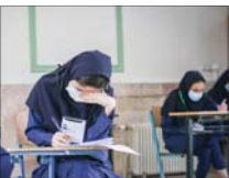
شرایط تازه برای حضور در امتحانات نهایی

رئیس پلیس مبارزه با مواد مخدر فرابجا با هشدار به زائران حج گفت: پلیس برابر قانون از ادامه سفر زائران حج که حتی به مقادیر بسیار اندک مواد مخدر، روانگردان، دارو و قرص‌های غیر مجاز و ممنوعه حمل می‌کنند، ممانعت بعمل آورده و برابر قانون با تشکیل پرونده قضایی، مجرم‌ان را به دستگاه قضایی معرفی می‌کند. سردار ایرج کاکاوند بر وجود قوانین سختگیرانه توسط کشور عربستان نسبت به حمل کنندگان مواد مخدر سنتی و روانگردان اشاره کرد و افزود: بر اساس قوانین مبارزه با مواد مخدر کشور عربستان، هر فردی نسبت به خرید، فروش، حمل و یا نگهداری مواد مخدر و