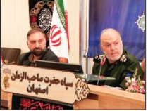
اصفهان، میزبان کنگره ۲۴ هزار شهید استان