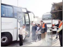
پیش‌بینی افزایش ۱۰ درصدی زائران اربعین اصفهان