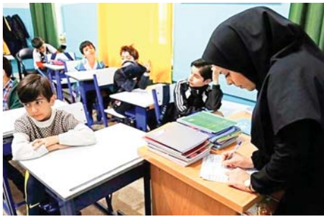
دولت وارد می‌شوند و این موضوع منجر به تأخیر در اعلام شهریه برخی مدارس شده است.

مدیر کل مدارس غیردولتی وزارت آموزش و پرورش افزود: شهریه مدرسی که براساس الگوی تعیین‌شده فراینداره طی کرده‌اند، تعیین شده است و به‌زودی در سامانه مشارکت‌ها بارگذاری می‌شود و خانواده‌ها تا پایان هفته می‌توانند شهریه جدید مدارس را مشاهده کنند.