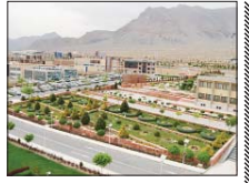
امروز: ادامه کمپ بین‌المللی سازی دانش‌بنیان‌ها