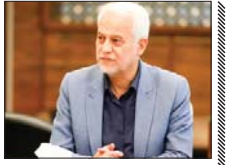
ارائه تجارب ۱۰۰ ساله بلیه به نسل جوان