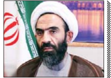
رئیس جمهور آینده تکلیف خود را با زاینده رود مشخص کند

نماینده مردم خمینی شهر در مجلس شورای اسلامی گفت: رئیس جمهور آینده باید تکلیف خود را نسبت به زاینده رود، آب و جبهه و طرح‌هایی که شهید جهپور آغاز کرده مشخص کند.