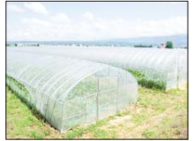
افتتاح ۹۰ پروژه کشاورزی در استان کهستان

وی تصریح کرد: البته می‌توان نسبت به عملکرد برخی از مسئولان در باب آب داشتن گزارش داد که کم لطفی کردند و با عنایت نداشتند اما مردم انتظار دارند که کاندیداهای تکلیف خود را نسبت به ۶ میلیون جریمت استان مشخص کنند.