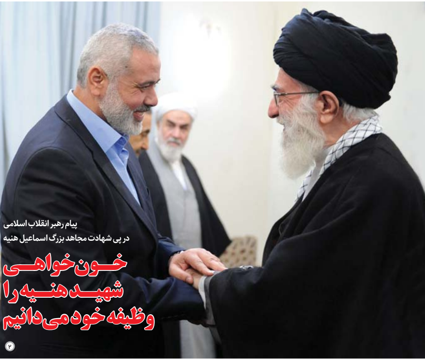
پیام رهبر انقلاب اسلامی در پی شهادت مجاهد بزرگ اسماعیل هنیه

خون خواهی شهید هنیه را وظیفه خود می دانیم