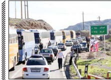
پیش‌بینی افزایش سفرهای اربعین با ناوگان عمومی اصفهان

کشور خبر داد و بیان کرد: استان اصفهان در این ایام به استان‌های همسایه هم‌سروس‌دهی می‌کند. مدیرکل راهداری و حمل‌ونقل اصفهان گفت: با توجه به سیل خروشان عاشقان اصفهان و استقبال گسترده زائران از سفر اصفهان، کمبود ناوگان عمومی در کشور و استان وجود دارد. وی با تاکید بر مدیریت توسط زائران تصریح کرد: برنامه سفر اصفهان باید به نحوی باشد که خروج از کشور به روزهای نزدیک به اصفهان منتهی نشود چرا که در این مواقع، تعداد ناوگان عمومی با سختگویی جابه‌جایی حجم عظیم زائران نخواهد بود.