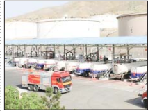
افزایش توزیع گازوییل در نیروگاه‌های اصفهان

بویژه نیروگاه‌های تولید برق استان ادامه دارد. کمیته مشترک بازرگانی کردک با افزایش نفت شهید محمد منتظری، کاشان، تاکنون و شهید فخرسکرسی‌پور، استان اصفهان نیز بدون وقفه در حال فعالیت هستند. همچنین، شرکت ملی پخش فراورده‌های نفتی منطقه اصفهان، عبدالله گیتی‌منش اعلام کرد: بیش از ۲۱۷ میلیون لیتر نفت گاز (گازوییل) «پور» در سه ماه نخست سال جاری نیروگاه‌های چهلستون، زواره و کاشان تامین و توزیع شده است. سویی با اشاره به نقش شرکت ملی پخش فراورده‌های نفتی در تولید پایدار برق تاکید کرد: با وجود گرمای ای-سابقه در تابستان امسال، سوخت‌رسانی گسترده و بدون وقفه به بخش‌های مختلف