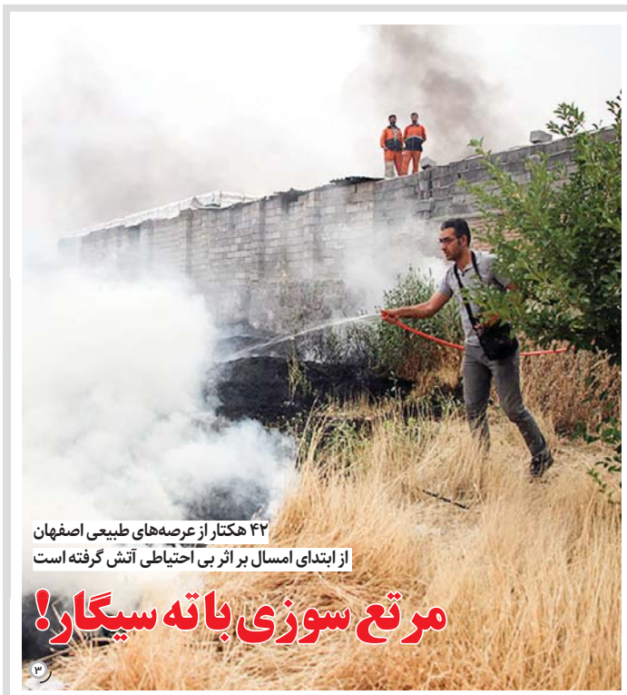
۴۲ هکتار از عرصه های طبیعی اصفهان از ابتدای امسال بر اثر بی احتیاطی آتش گرفته است