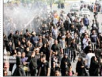
پیاده روی جاماندگان ارمنین در اصفهان برگزار می‌شود