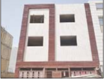
بررسی نمای ۷۰۰ ساختمان در کلانشهر اصفهان