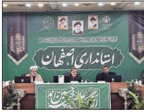
ثبت‌نام ۱۸۲ هزار اصفهانی در سامانه سماح