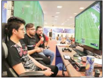
گیمرها در اصفهان دست به «دسته» شدند