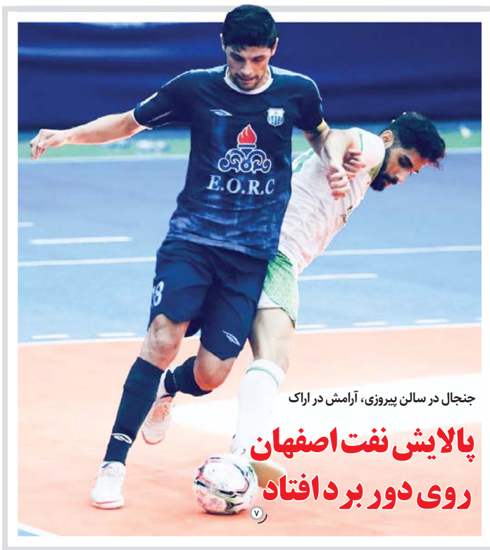
جنجال در سالن پیروزی، آرامش در اراک