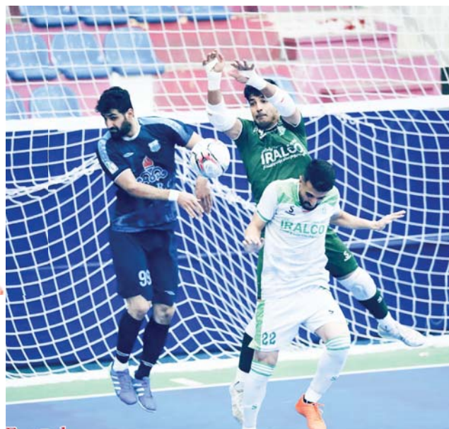
دسترس قرار بگیرد.