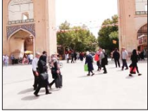
بازدید ۴۷۲ هزار گردشگر خارجی و داخلی از اصفهان

هزار تومان بودجه اعتبار در استان اصفهان در دست اقدام است. گفتنی است میدان تاریخی نقش جهان (با اولویت مساجد امام، شیخ لطف اله، عمارت عالی قاپو و بازار قیصریه) و مجموعه‌های جهانی باغ فغان و کاشان و باغ موزه چهلستون در صدر بازدید اسمازل گردشگران خارجی و داخلی قرار دارد. شهرتاریخی‌های غرب استان اصفهان شامل گلپایگان، تیران و کرون، خوانسار، فریدن، فریدونشهر، بوئین میاندشت، و چادگان، همچنین ناین و اردستان در شرق استان، در کنار اصفهان و کاشان، رتبه‌های برتر بازدید گردشگران را از ابتدای سال تاکنون داشته اند.