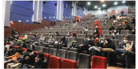
در صفحه ۲ بخوانید

هشدار زرد هواشناسی درباره افزایش دما تا ۴۷ درجه سانتیگراد