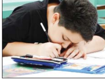
ارائه برنامه‌های اوقات فراغت به ۴۰۰ هزار دانش‌آموز

می‌شود. مدیرکل آموزش و پرورش اصفهان با بیان اینکه آموزش و پرورش به‌عنوان اصلی‌ترین، مهم‌ترین و اساسی‌ترین نهاد تعلیم و تربیت، هرگاه مورد توجه قرار گرفته، جامعه رو به تعالی حرکت کرده است. افزود: هم‌اکنون بودجه‌ها و هزار یگان‌ها برای ارائه برنامه‌های اوقات فراغت دانش‌آموزان راه‌اندازی شده است. وی برنامه‌های اوقات فراغت امسال را با شعار «تربیت بدون توقف» و با رویکرد «مدرسه‌محوری» دانست و گفت: غنی‌سازی اوقات فراغت دانش‌آموزان با هدف‌های متعدد و استوار، فعالیت‌های تربیتی سال تحصیلی در طول تابستان اجرا می‌شود.