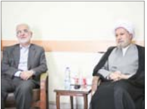
ضرب‌الاجل وزیر کشور برای خروج اتباع بیگانه

به سنوات خدمت آنها افزوده می‌شود. افراد دارای ۱۵ تا ۲۰ واریز حق بیمه، به ازای هر سال باقی مانده تا ۳۰ سال خدمت، ۴ ماه به سنوات آنها افزوده می‌شود. بیمه پردازان با کمتر از ۱۵ سال سابقه واریز خدمت، ۵ سال به سابقه خدمت آنها افزوده می‌شود و زمان بازنشستگی آنها بعد از ۳۵ سال خدمت است.