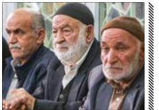
چه کسانی با ۳۵ سال خدمت بازنشسته می‌شوند؟

بر اساس آنچه در قانون برنامه هفتم پیشرفت به دستگاہی اجرایی ابلاغ شد، افزایش سن بازنشستگی تا ۳۵ سال خدمت امکان پذیر است. بر این اساس کسی که ۲۸ سال تمام سابقه بیمه پردازی دارد، مشمول تغییر سنوات بازنشستگی نشده و با ۳۰ سال خدمت بازنشسته می‌شوند. افراد دارای سابقه پرداخت حق بیمه بین ۲۵ تا ۲۸ سال، به ازای هر سال باقی مانده تا ۳۰ سال خدمت، ۳ ماه به زمان واریز حق بیمه الزامی آنها افزوده می‌شود.